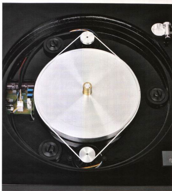
На фото виден субдиск, вращающие его моторы и массивные черные винты, на которых субшасси висит в корпусе.

Тонарм, установленный на проигрывателе, — собственная разработка компании. Тонарм 10-дюймовый одноопорный, но сконструирован необычно. Если